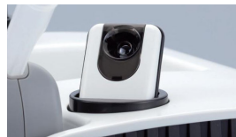
高性能温度センサー搭載。 測温し、測定値をPCに転送。