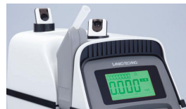
アルコール検知器の精度 を決める心臓部に燃料 電池式センサーを搭載。