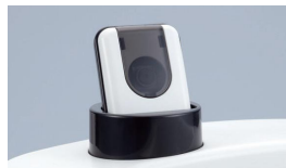
高性能カメラ搭載。 測定者の顔を撮影。 不正防止に役立ちます。