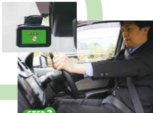
STEP 3 わき見運転や車間距離不足など危険運転をAIドラレコが自動検知します。