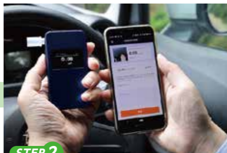
STEP 2 測定結果を送信すると、専用アプリに運行データとまとめて保存されます。