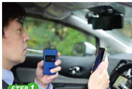
STEP 1 出先でスマホと連動しアルコールチェックをします。