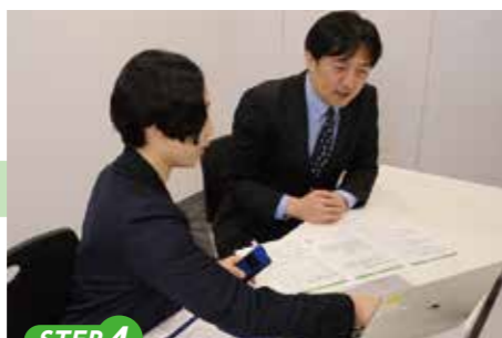
STEP 4 管理者はアルコールチェックと日々の運転結果をもとにドライバーにあった内容で安全指導を実施できます。