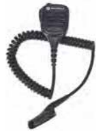
PMMN4067 IMPRES™ リモートスピーカーマイク