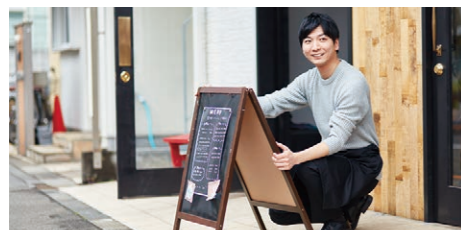
フロアが分かれた店舗などで