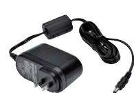
急速充電器用ACアダプタ SK-P03