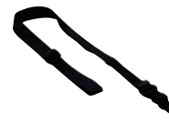
ネック ストラップ SK-T03