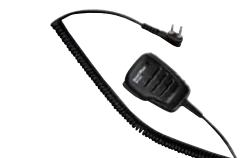
防水スピーカーマイク SK-M04 (IP67*相当防水・防塵性能 スピーカー出力0.5W)