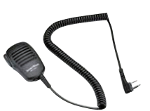
スピーカーマイク SK-M01 (スピーカー出力0.5W 3.5φイヤホン端子付き)