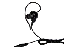
スピーカーマイク用 イヤホン SK-E01 (ケーブル長 約0.5m)