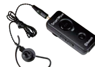
Bluetooth® イヤホンマイク SK-M03