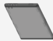
標準 2900mAh リチウムイオン 電池パック BT000592A01