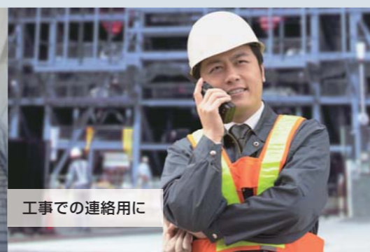
工事での連絡用に