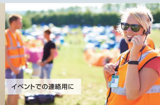
イベントでの連絡用に