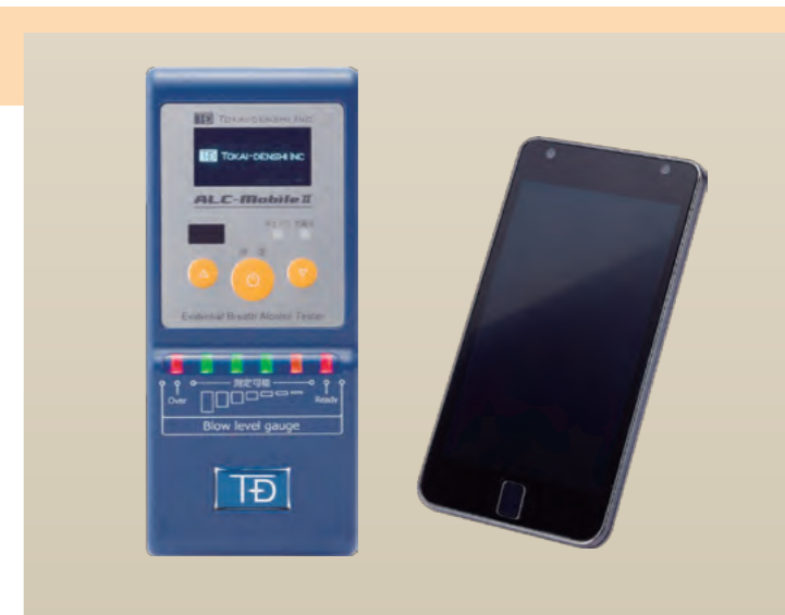
• 携帯電話の対応機種は当社ホームページでご確認ください

Bluetooth 接続でスマートフォン (Android) との連動が可能です。測定専用の Android アプリによって、顔写真付きのデータを送信することができます。音声ガイドや日本語表示で、操作がより分かりやすくなりました。また、圏外での測定や、携帯電話の電池切れ時でも、測定器本体に日時付き測定結果を保存しますので、後で確認する事が可能です。