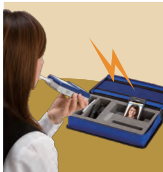
購入時期により、ケースが変更になる場合があります。

物流センター・宿泊先・パーキングエリア…いつ、どこにいても手軽に点検ができ、測定結果が自動的に管理者宛にメール送信されるので、常にリアルタイムの乗務員管理を実現。また自動送信により測定結果の改ざんも防止できます。