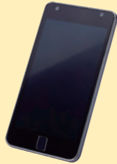
スマートフォン ※時期により対応機種が変わります。