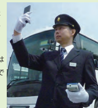
• 携帯電話の対応機種は当社ホームページでご確認ください

各営業所の測定、点呼の結果は クラウド型動画点呼システムで 点呼動画データはいつでも確認可能!