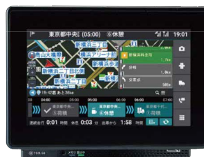
■ ナビゲーション機能